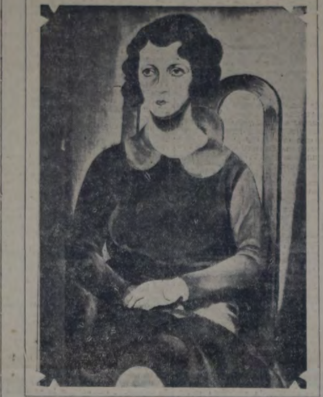
FIGURA.— Oleo del joven pintor argentino Manuel Eichelbaum, expone en el salón de artistas, a inaugurarse en Rosario a fines de agosto y que acentúa ya una madurez indiscutible